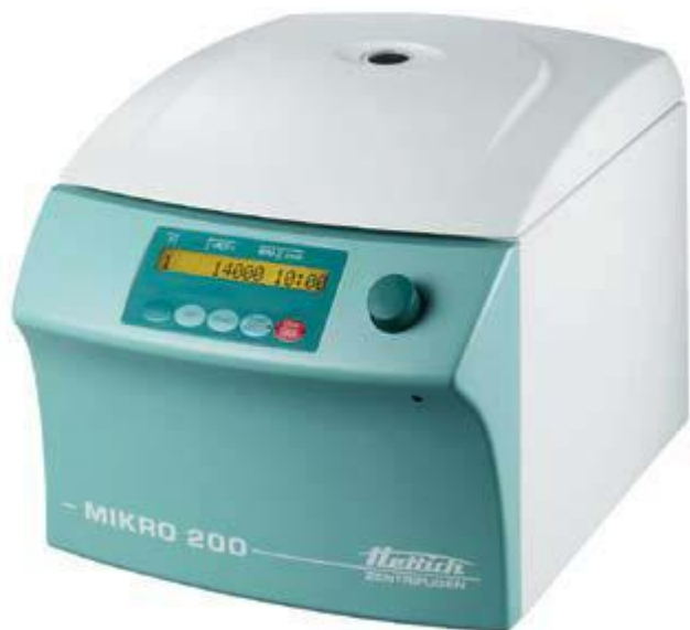
Таблица для комплектации центрифуги